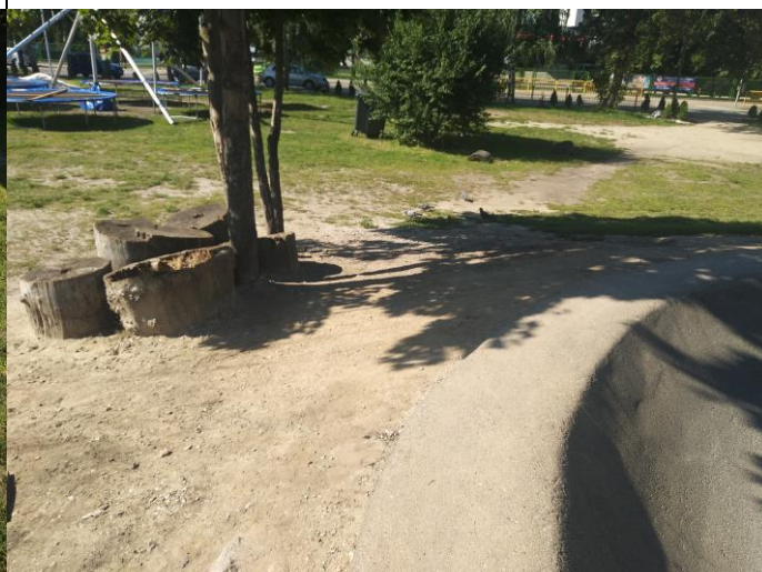
Fot nr 2

Oświadczam, iż ustalenia zawarte w protokole są zgodne ze stanem faktycznym: