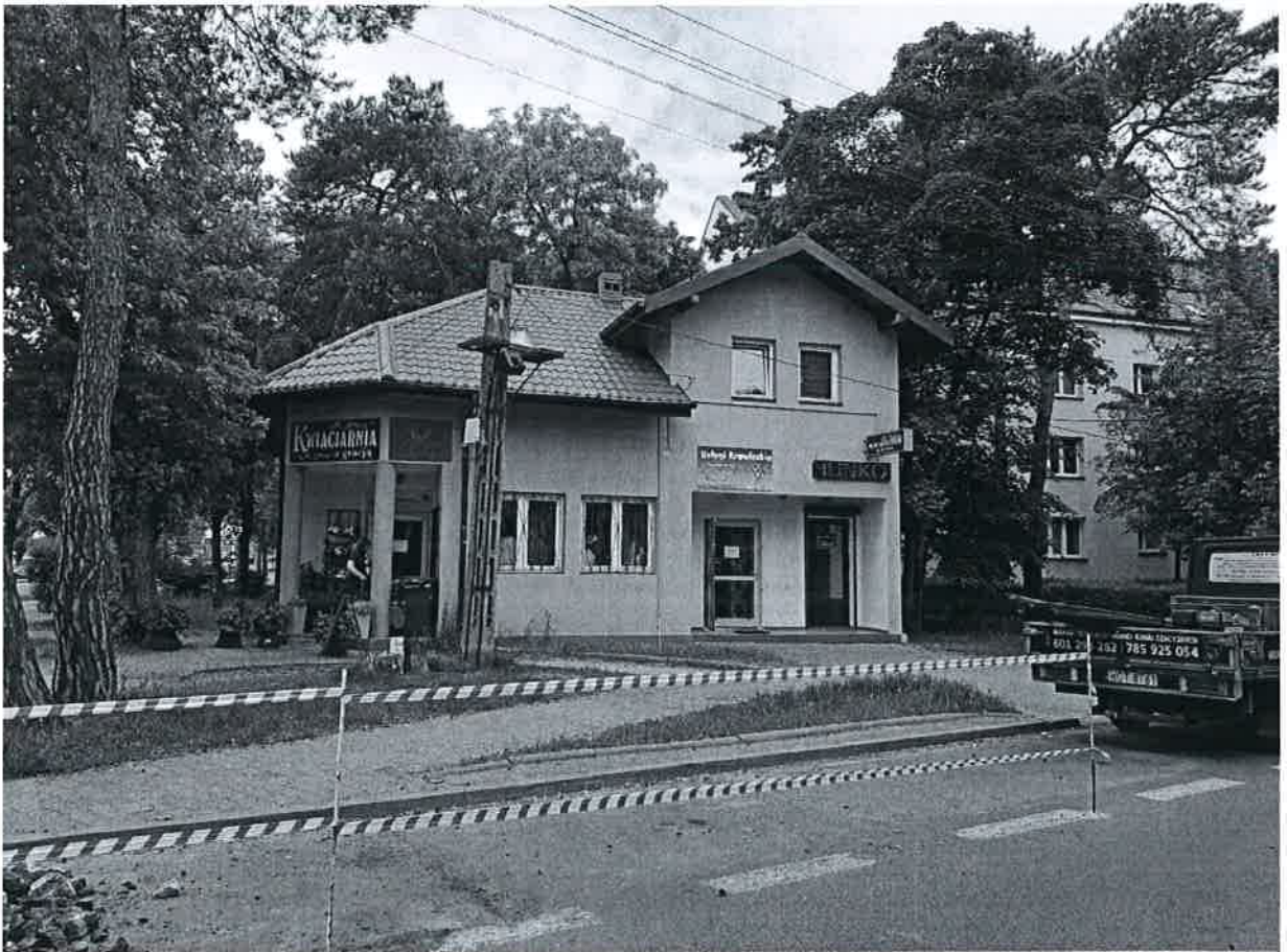
Замітка комерційно-підприємству м. Нуспінцієво 8А