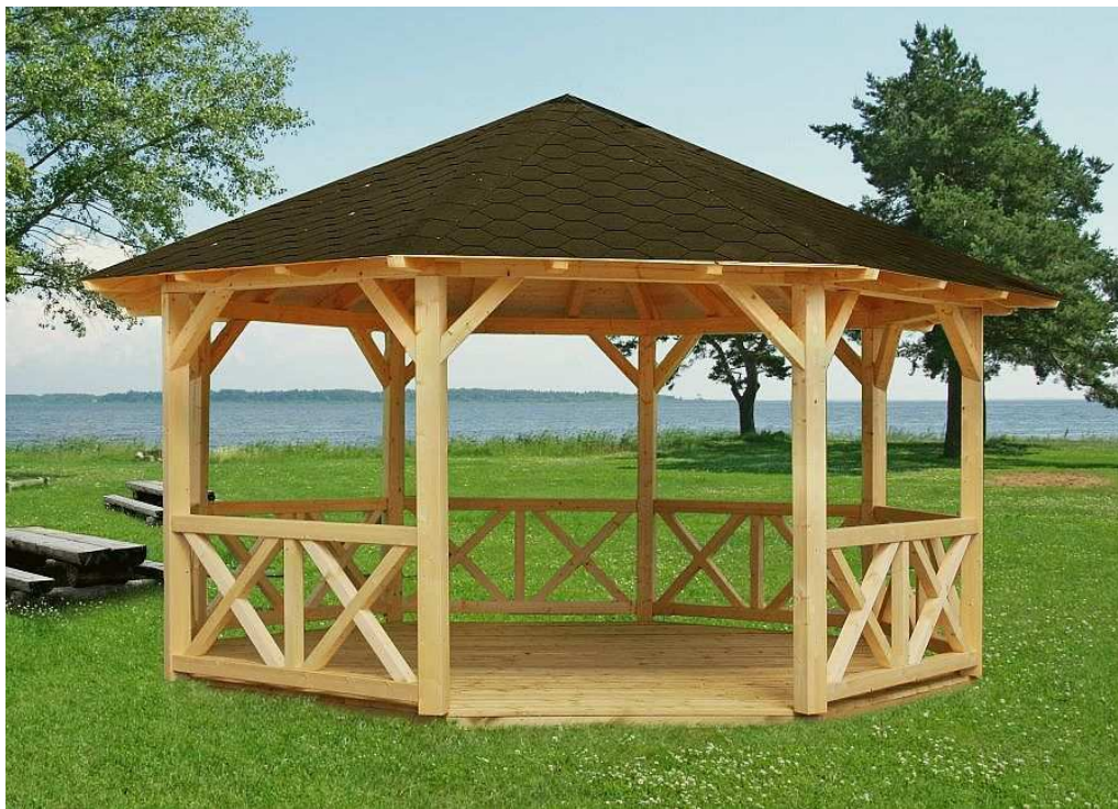
Altana ogrodowa ośmiokątna